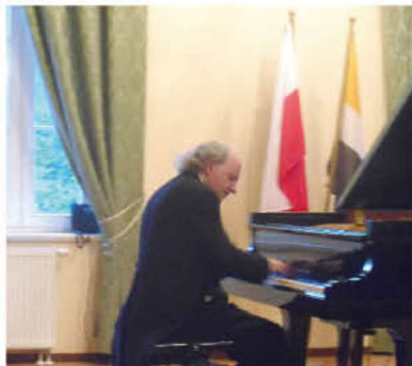
Światowej sławy pianista Aleksiej Orłowiecki wystąpił w Trzebnicy po raz ósmy.